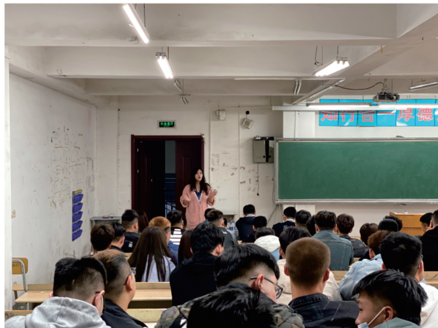
辅导员宣讲班会内容