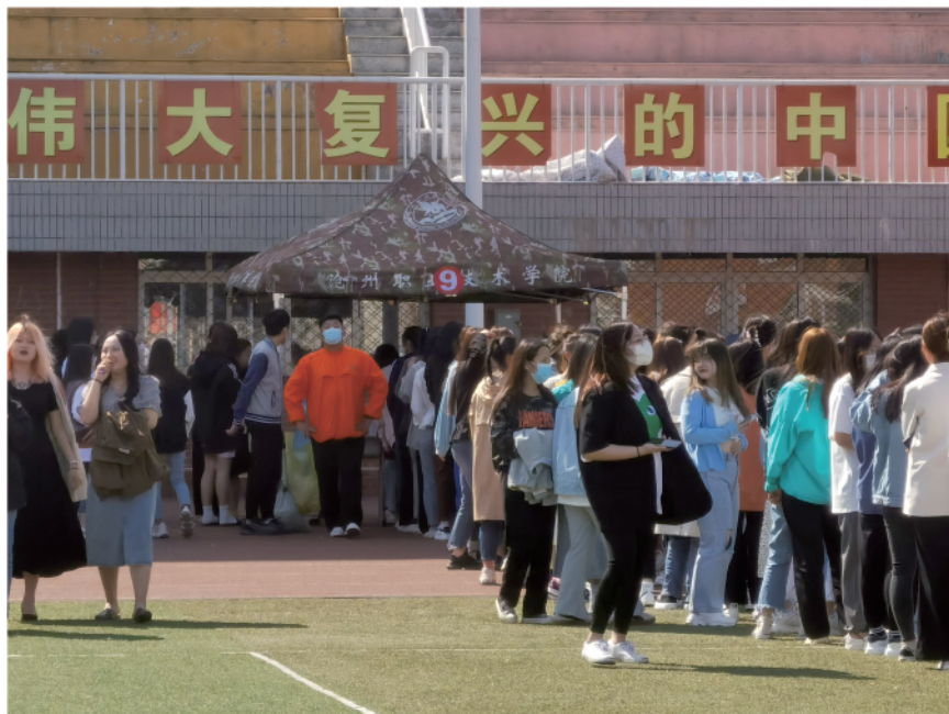
学院安排学生核酸检测