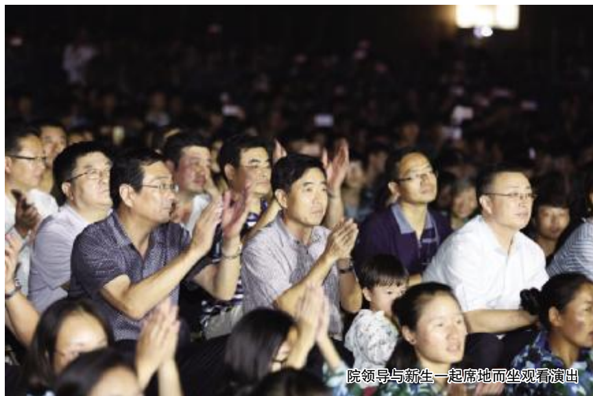
院领导与新生一起席地而坐观看演出