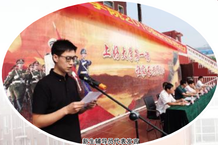
新生辅导员代表发言