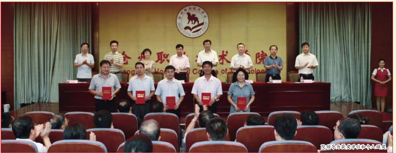
院领导为获奖单位和个人颁奖