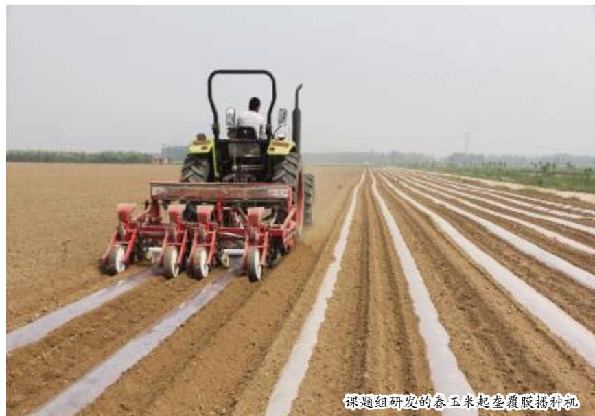
课题组研发的春玉米起垄覆膜播种机

我们发现,这些创新都不是很难的,就像牛顿看到苹果落地万有引力为人类掌握,因水蒸汽鼓动水壶盖瓦特发明蒸汽机,其实创新就是需要我们多些用心、多些思考。