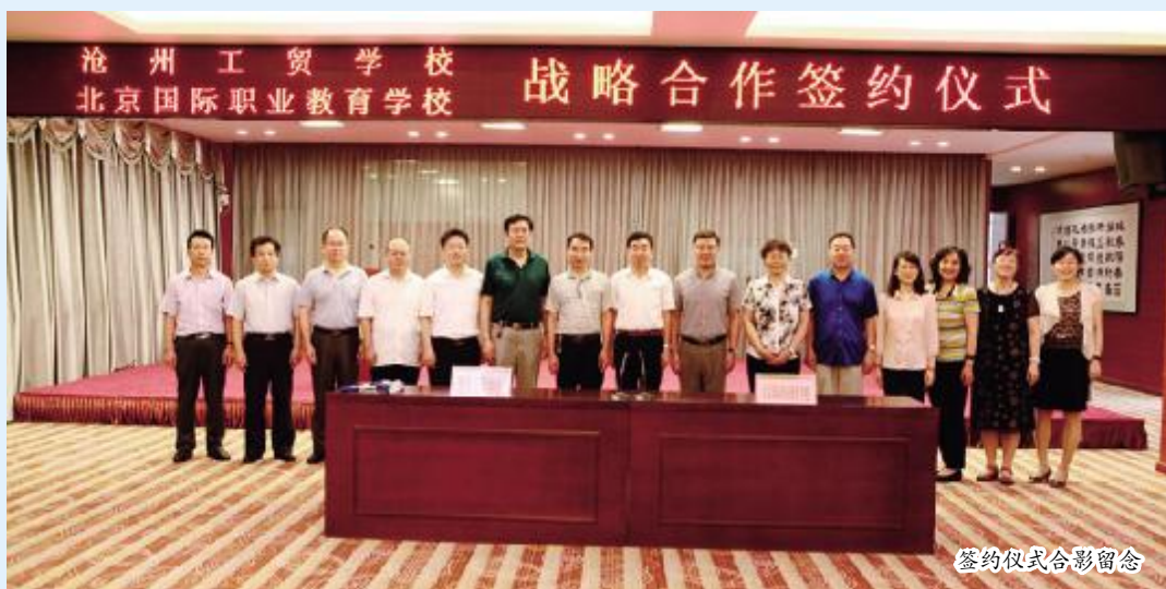
签约仪式合影留念

建设、学生实习实训、师资队伍建设等多个领域开展合作,实现资源共享、优势互补,共同促进双方职业教育水平的大发展、快发展。