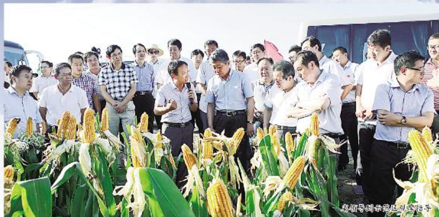
市领导到渤海粮仓科技示范工程核心区调研

到2017年增粮10亿斤,到2020年增粮15亿公斤的任务,这是渤海粮仓科技示范工程为沧州描绘的美好蓝图。沧州市农林科学院肩负着沧州地区农业科技创新的使命,该院紧紧围绕服务粮食生产、农民增收和实现农业可持续发展的目标,全面提升自主科技创新能力,加速推进成果转化,全面加强科技服务,以科技为引领,推进环渤海低平原雨养旱作区增产增效关键技术模式研究与示范任务,提升示范工程建设质量,让盐碱之地变身“渤海粮仓”,也让百姓收获了实实在在的实惠。