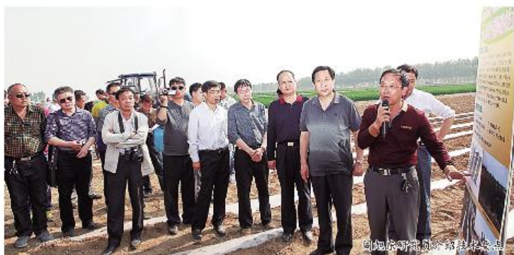
沧州市农林科学院专家到渤海粮仓核心区调研