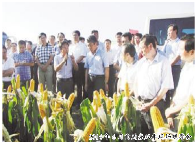
2014年6月曲周麦双丰现场观摩会

河北省是渤海粮仓科技示范工程这一国家科技支撑计划项目实施的主要区域，覆盖面积占总面积的60%，涉及沧州、衡水、邢台、邯郸4市和曹妃甸区共计43个县(市)，耕地面积3000万亩，占全省耕地面积的34.8%。