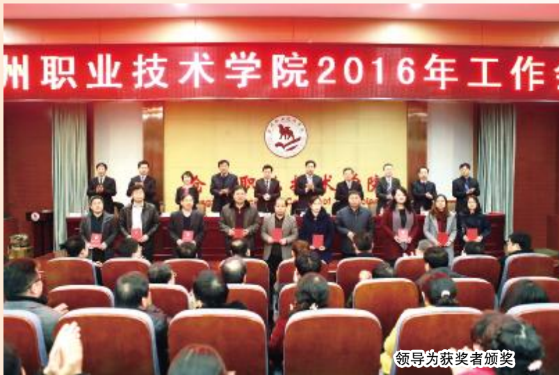
领导为获奖者颁奖