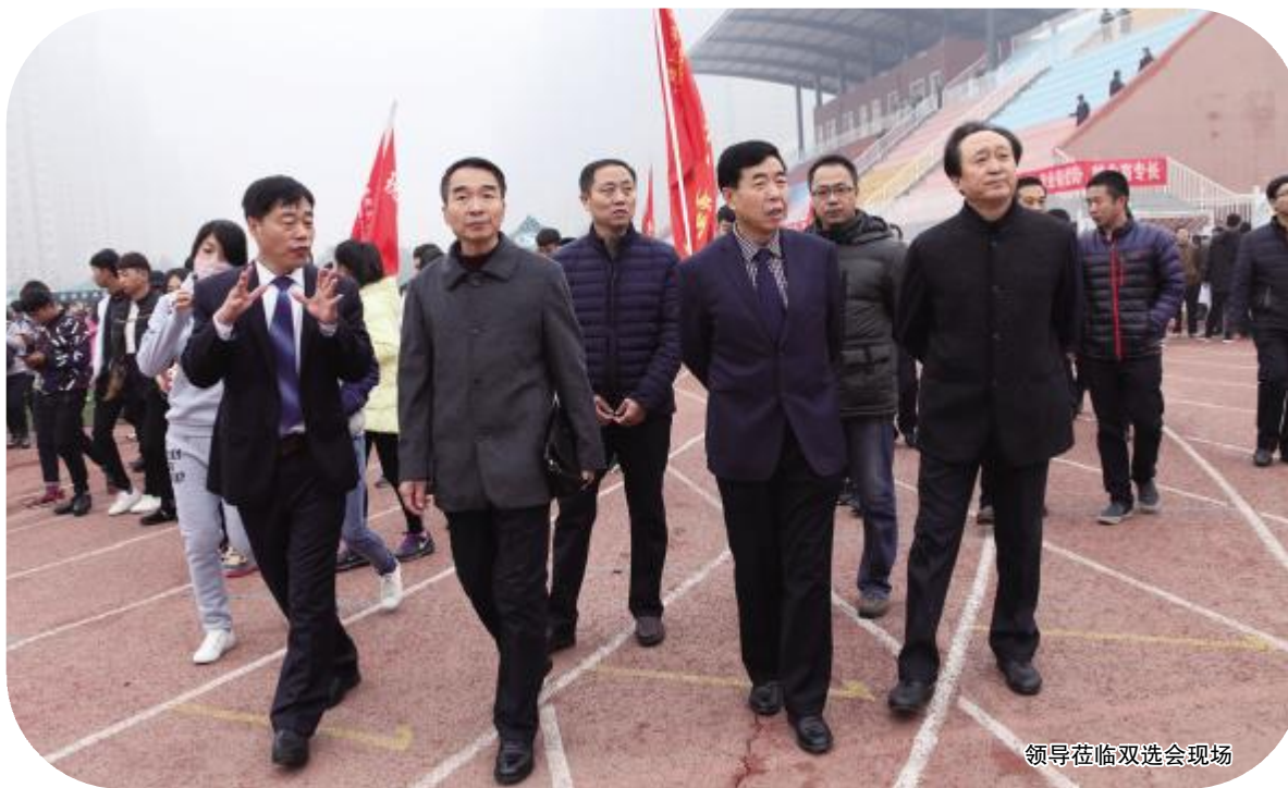
领导莅临双选会现场