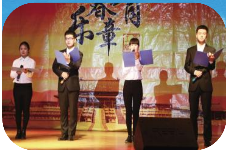
2016年11月10日晚,沧州职院信息工程系信息之星风采大赛在学院礼堂成功举办。大赛以:“筑梦青春,华彩飞扬”为主题,旨在展示信息学子风采,