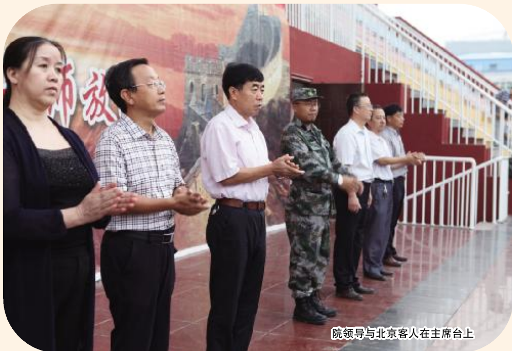
院领导与北京客人在主席台上