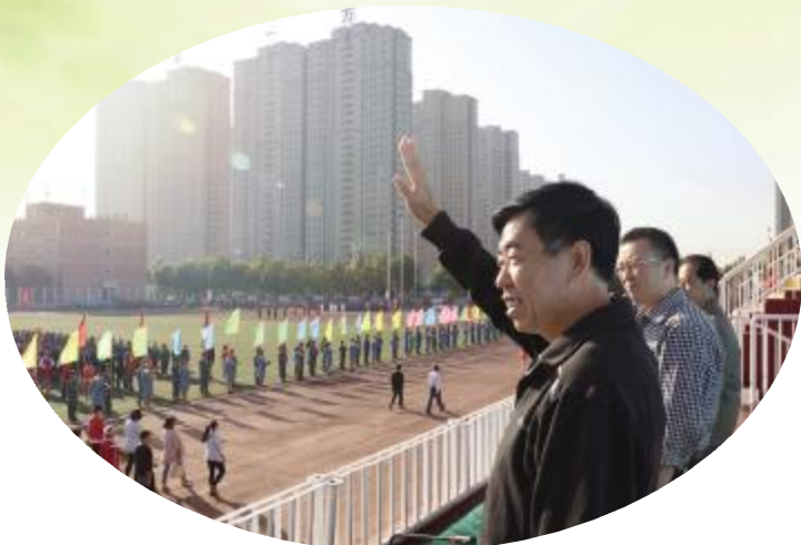
▲院领导检阅运动员队伍