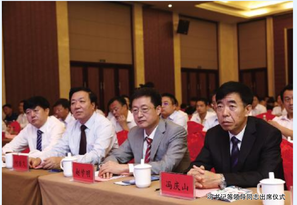
冯书记等领导同志出席仪式