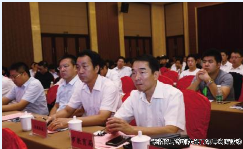
市教育局等有关部门领导出席活动