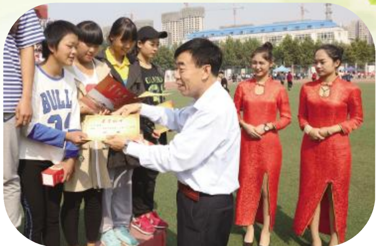
▶冯书记为优秀运动员颁奖