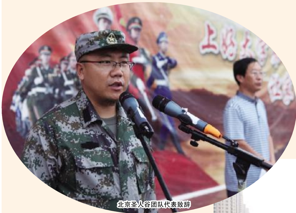
北京圣人谷团队代表致辞