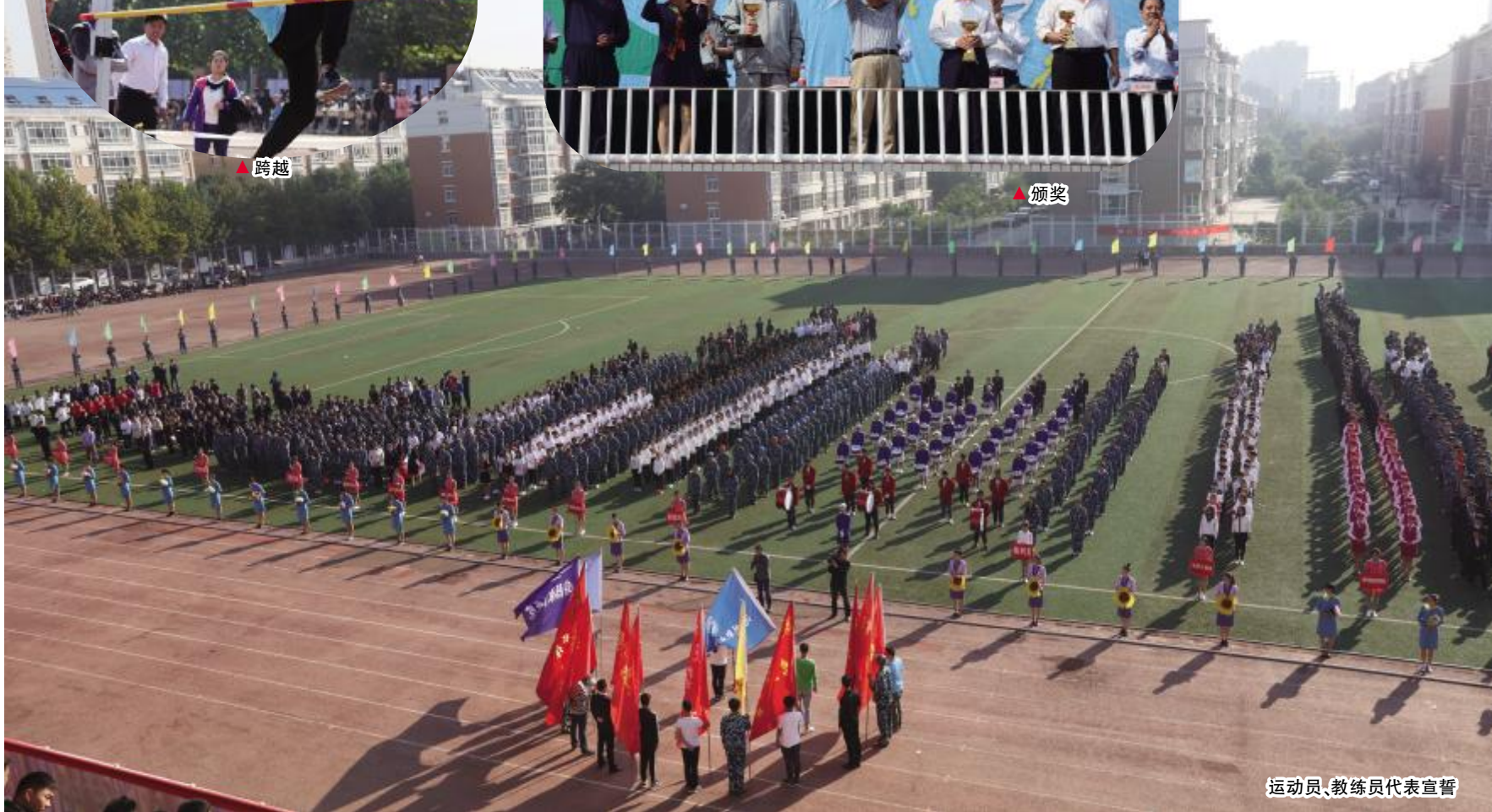
运动员、教练员代表宣誓