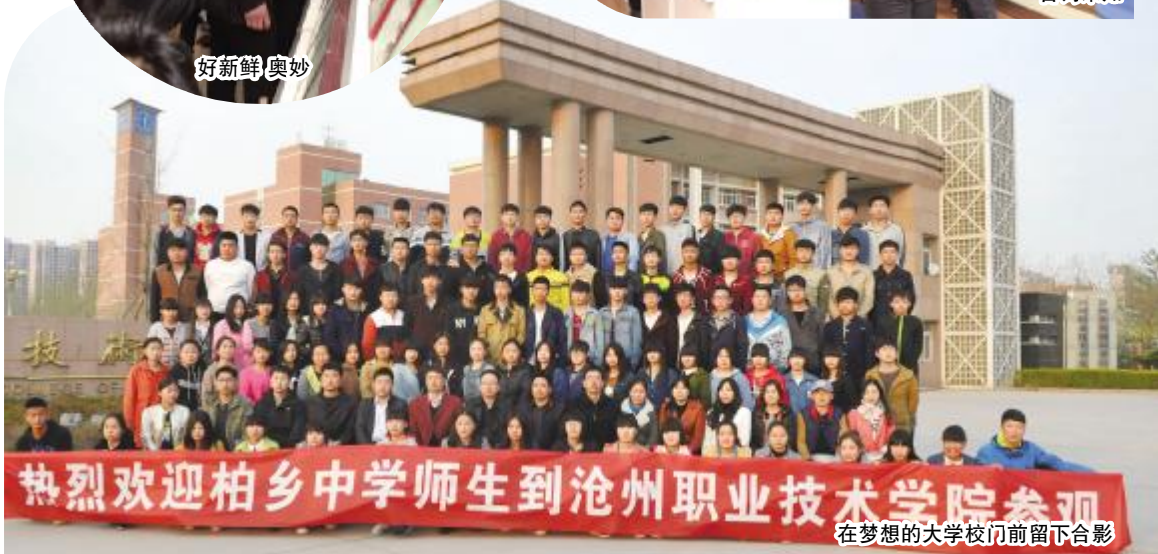
热烈欢迎柏乡中学师生到沧州职业技术学院参观 在梦想的大学校门留下合影