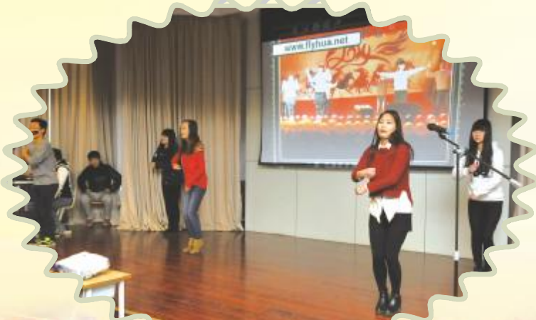
才艺展示——勇往直前