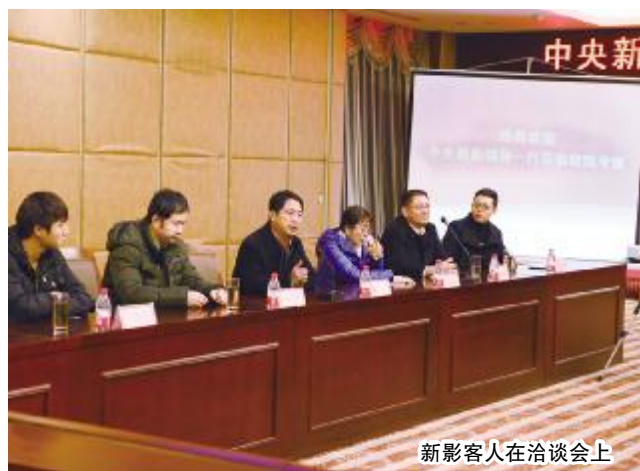
新影客人在洽谈会上