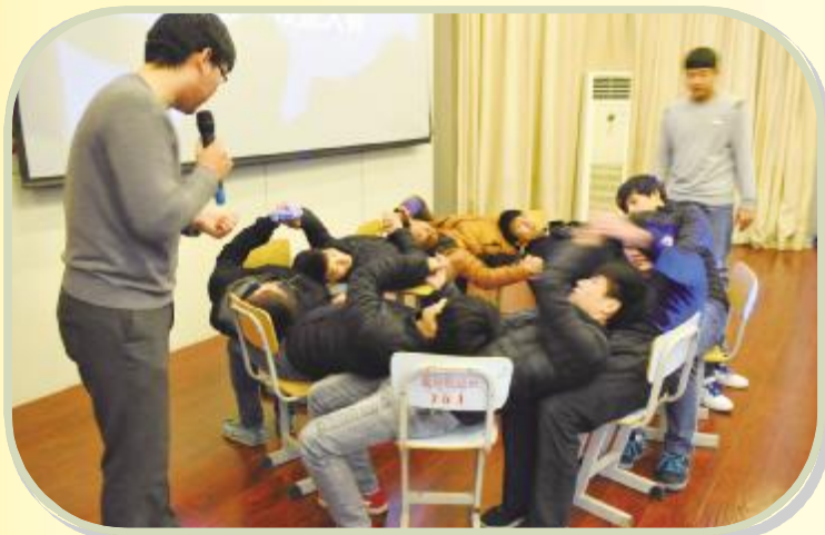
才艺展示——团结协作