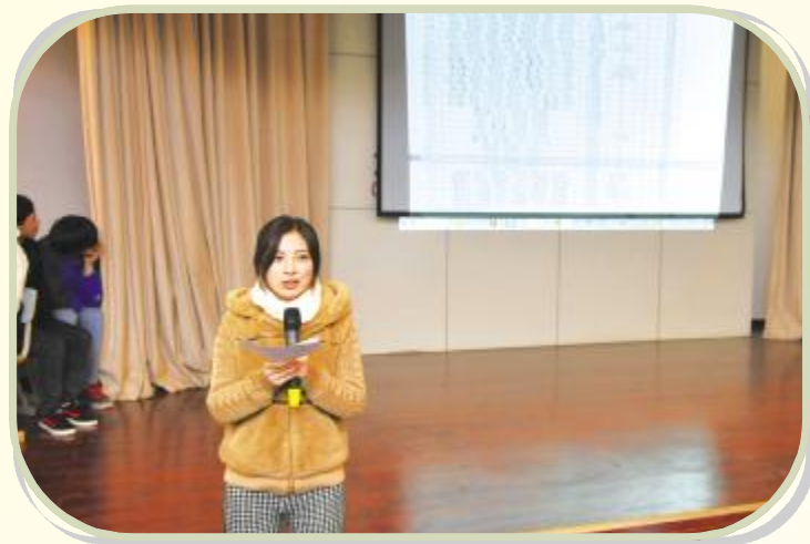
才艺展示——班情熟知