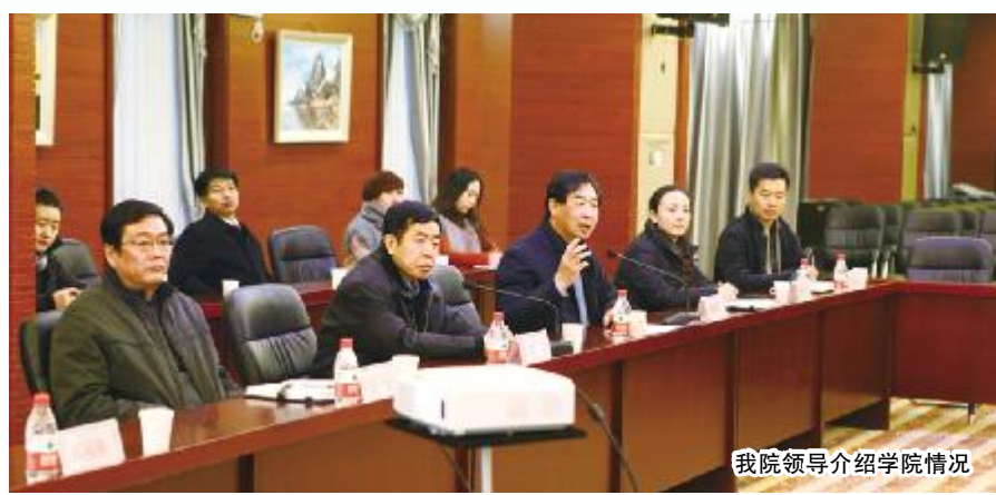
我院领导介绍学院情况