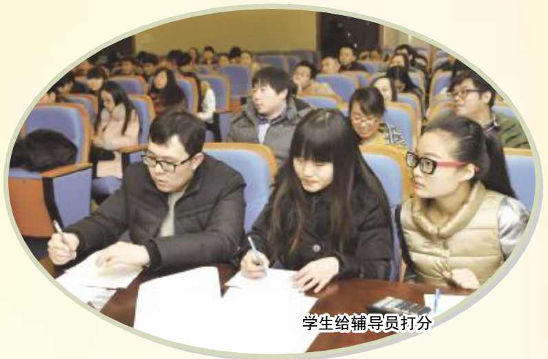
学生给辅导员打分