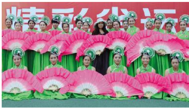
教师在体育馆外带领学生做最后的排练