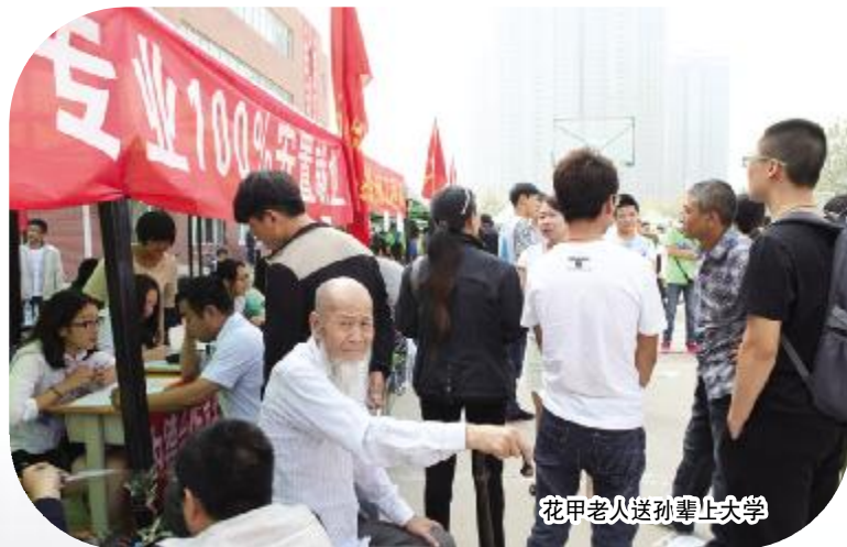
花甲老人送孙辈上大学