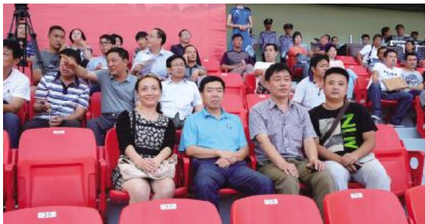
院领导在市体育馆现场观摩、指导学生队伍彩排