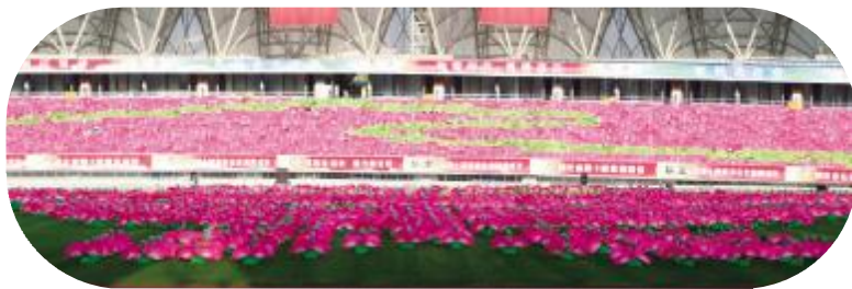
沧州职院学生似铿锵玫瑰、如花绽放