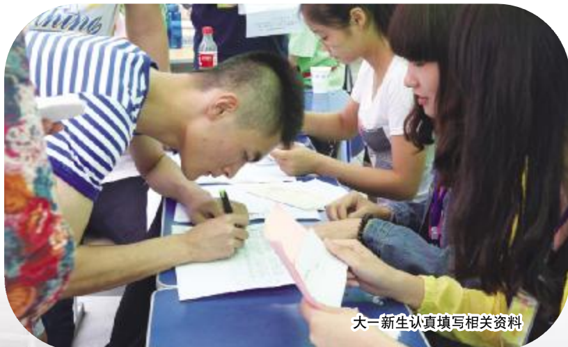
大一新生认真填写相关资料