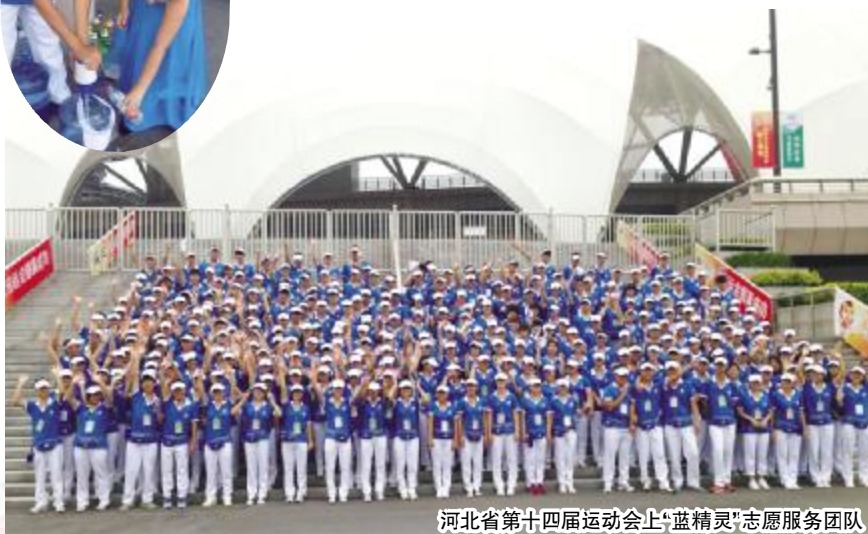
河北省第十四届运动会上“蓝精灵”志愿服务团队