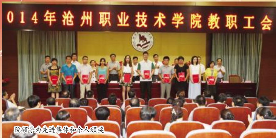
院领导为先进集体和个人颁奖