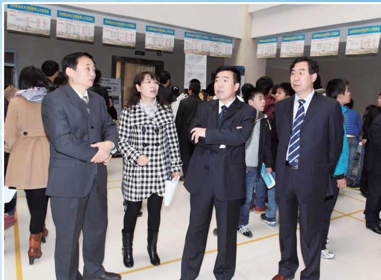
院领导在双选会现场