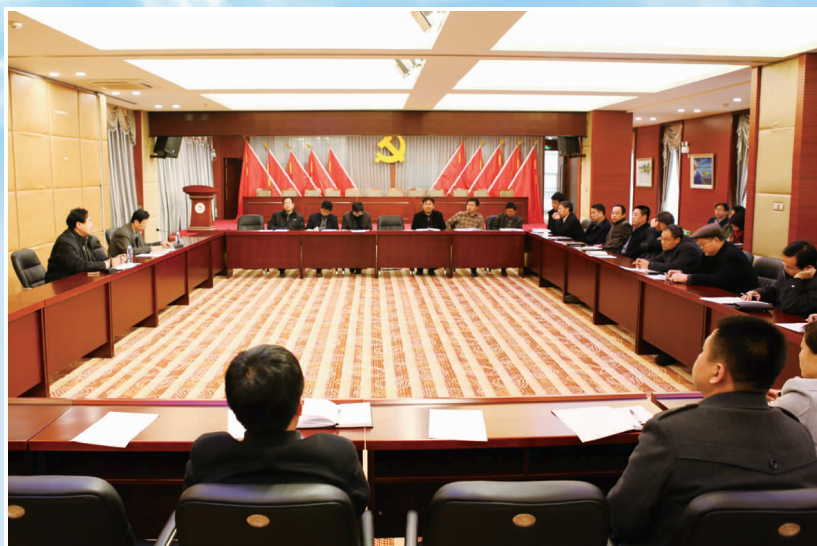
学院召开专门会议,安排调度人才双选会