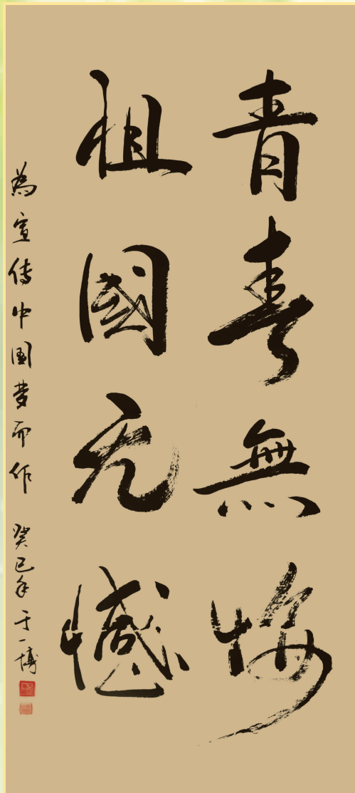
為宣傳中國夢而作 癸巳年于博