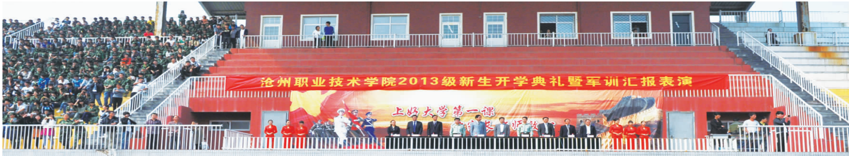
沧州职业技术学院2013级新生开学典礼暨军训汇报表演