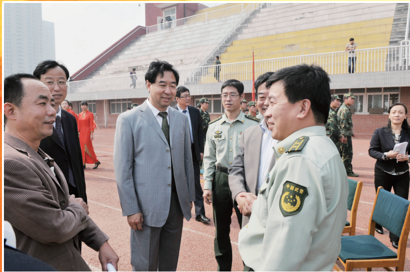
▲院领导与部队官兵亲切交谈