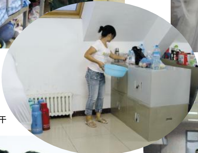
▶自己的事情自己干