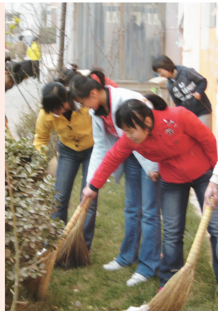
信息工程系团总支带领全系青年志愿者们开展「职院是我家,清洁靠大家」活动